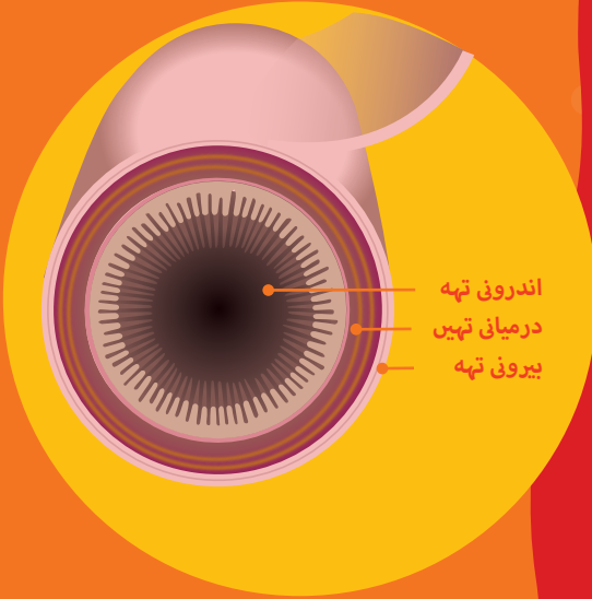
آنت کی تھیں

آپ کی آنتوں کی دیواریں تھوں پر مشتمل ہوتی ہیں۔ یہ تھیں غذائی اجزاء کو جذب کر لیتی ہیں جبکہ فضلے کو خارج کر دیتی ہیں۔